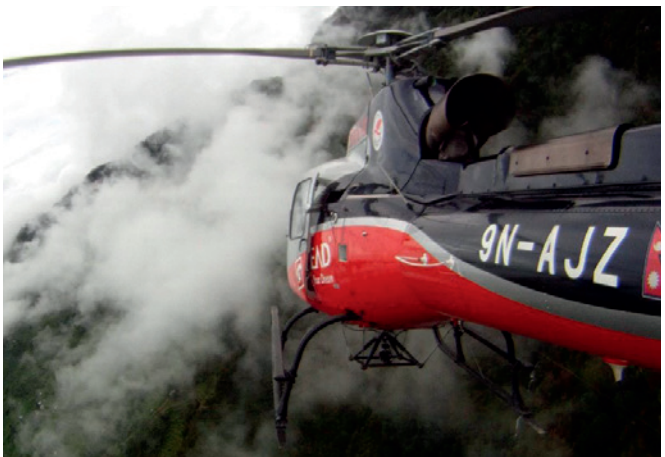
Hubschraubereinsatz nach Erdbeben in Nepal

Wir sind für Sie da bei Evakuierungen (Land-, See-, Luftweg), Verhaftung, Erpressung, Geiselnahme oder Entführungen von Mitarbeitern. Unsere Berater begleiten Sie 24/7 im Notfall-, Krisen- und Kontinuitätsmanagement (BCM).