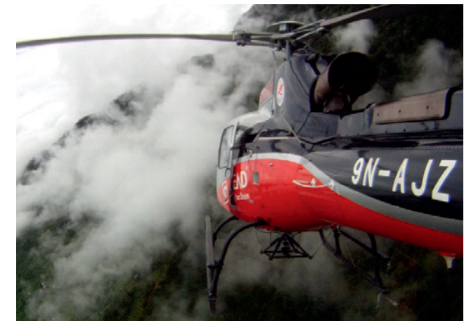
Hubschraubereinsatz nach Erdbeben in Nepal

Wir sind für Sie da bei Evakuierungen (Land-, See-, Luftweg), Verhaftung, Erpressung, Geiselnahme oder Entführungen von Mitarbeitern. Unsere Berater begleiten Sie 24/7 im Notfall-, Krisen- und Kontinuitätsmanagement (BCM).