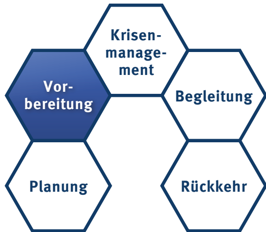
5-Phasen-Modell für Auslands- & Reisesicherheit